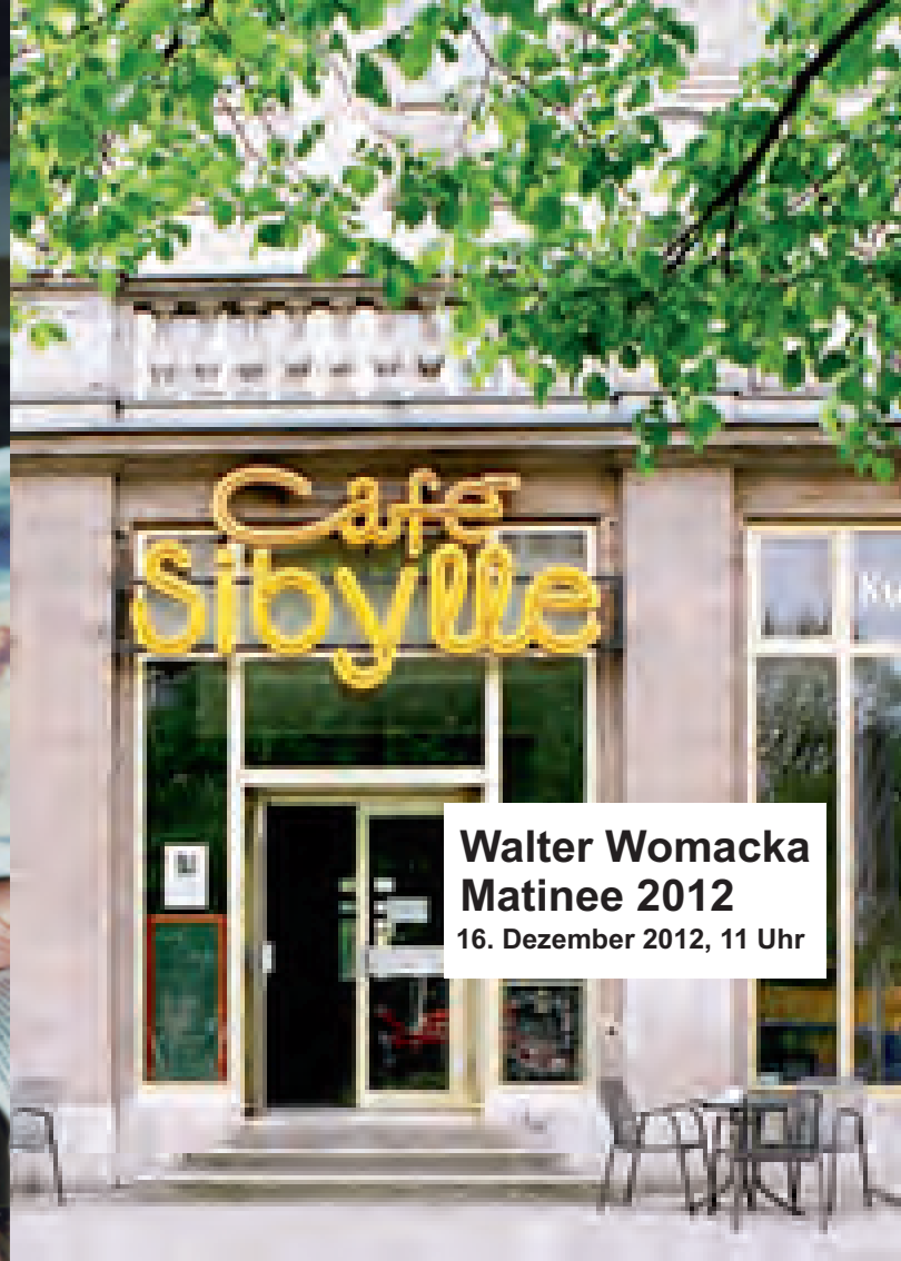
Walter Womacka Matinee 2012 16. Dezember 2012, 11 Uhr