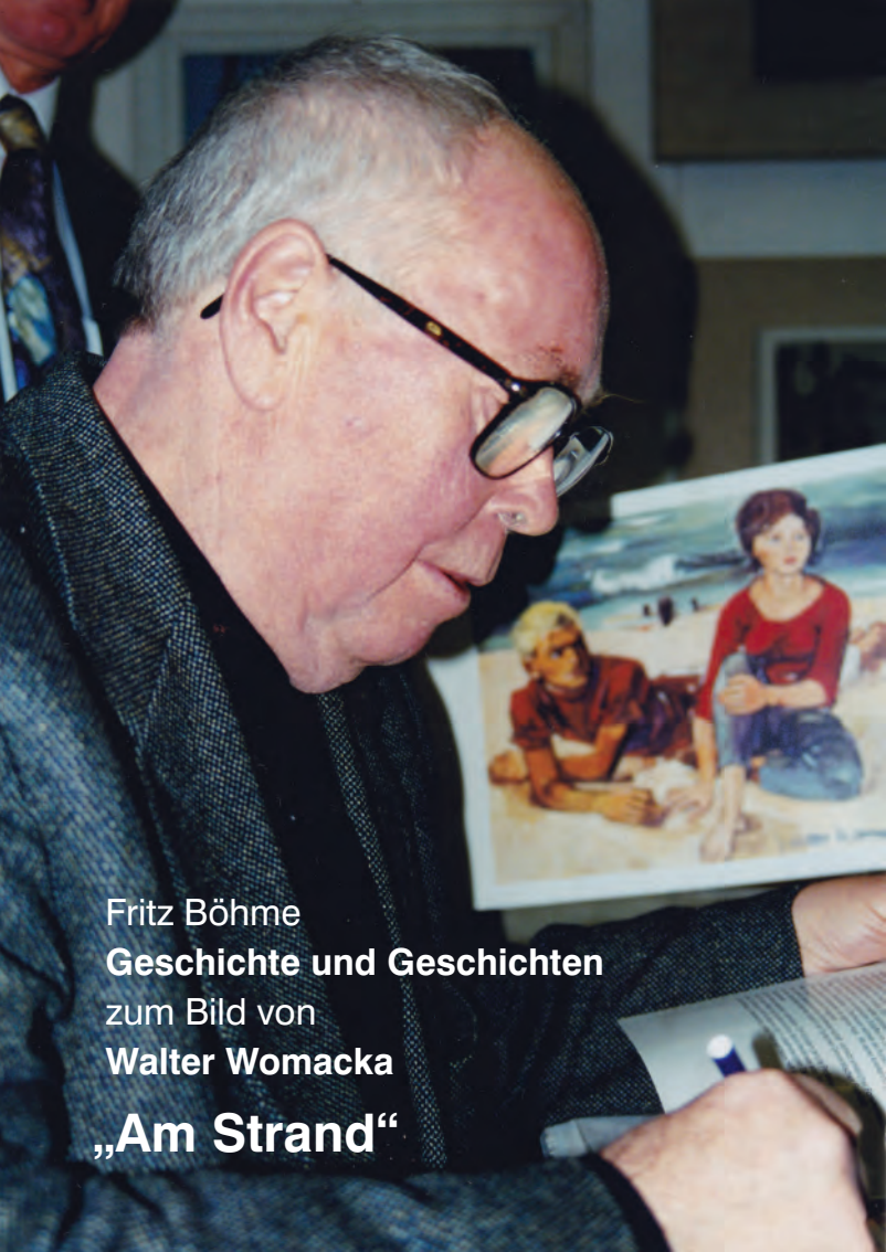
Fritz Böhme Geschichte und Geschichten zum Bild von Walter Womacka „Am Strand“