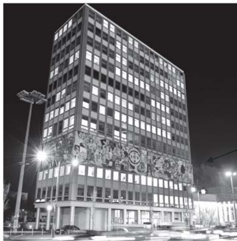
Unser Leben, Walter Womacka (1964)