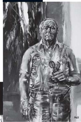
Selbstbildnis, Walter Womacka (1988)

WBM Wohnungsbaugesellschaft Berlin-Mitte mbH